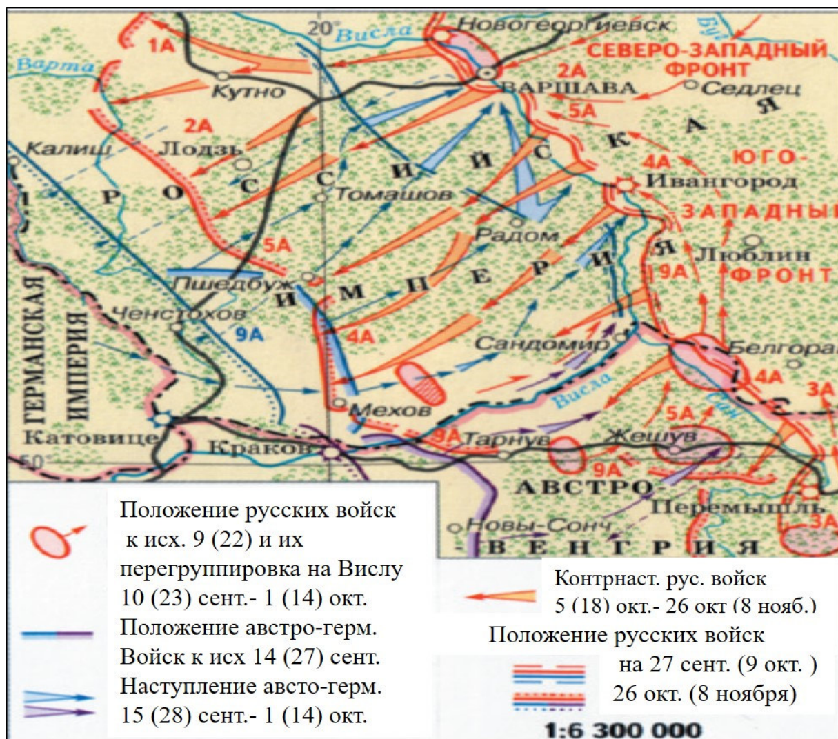
Рис. 1. Варшавско-Ивангородская операция. 15(28) сентября – 26 октября (8 ноября) 1914 г.

ставилась задача прикрыть весь фронт армии силами корпуса со стрелковыми бригадами. Остальные силы этой армии размещались в районе Краковец, Яворов, Мосциска и определялись в маневренную подвижную группу для развития удара в связи со складывающейся обстановкой. Часть армейской кавалерии обеспечивала блокадный корпус с юго-западной стороны [2, с. 49–50].